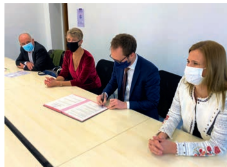
La municipalité et l'association Actiom ont mis en place un dispositif afin de proposer aux Ovillois une mutuelle s'adressant au plus grand nombre.

Permanences, le 2 e et le dernier lundi de chaque mois, de 13 h 30 à 17 h 30. Prochaines permanences : 14 et 28 décembre. Inscriptions auprès du CCAS (1, rue Jules-Guesde). Tél. : 01 30 86 32 70.