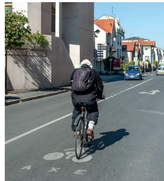
Sur la route, il est important de bien être vu et d'avoir un vélo en bon état afin de garantir sa sécurité et celle des autres usagers de la route.