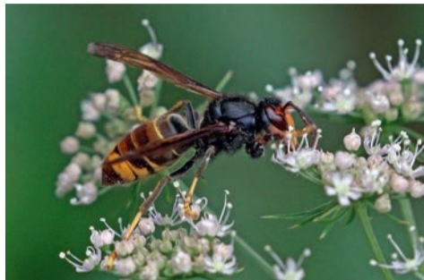
Le frelon asiatique.

Le printemps est déjà là ! Symbole du réveil de la nature, de renaissance et des premiers jours ensoleillés, le printemps est également la période où de nombreuses espèces d'insectes émergent pour reprendre leur activité. C'est pourquoi la Ville de Houilles vous invite à redoubler d'attention pour éviter la prolifération de certaines espèces considérées comme nuisibles pour l'homme et son environnement.