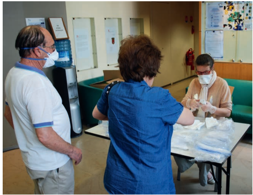
Les agents d'accueil de la mairie ont distribué, dès le 27 avril, des masques de protection aux Ovillois prioritaires (personnes âgées ou vulnérables, en situation de handicap...).

posaient face à la crise sanitaire. Cependant, certains agents dont les missions ne sont pas réalisables en télétravail ont continué à assurer leur activité sur place, en mairie ou en extérieur, en adoptant les gestes barrières imposés. Parmi eux, nous pouvons citer les agents des services techniques, qui réalisent entre autres le nettoyage de la voirie, les policiers municipaux, qui assurent une partie de leurs missions traditionnelles, les infirmières, qui continuent d'effectuer les soins à domicile, les agents de la restauration, qui préparent chaque jour les repas aux seniors, les personnels de la petite enfance et de la résidence Les Belles-Vues, qui poursuivent leurs missions d'accompagnement, ou encore les agents administratifs, qui participent également à la continuité du service public. ■