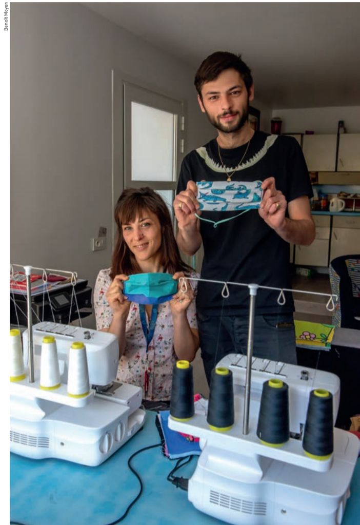
La fabricante de vêtements sur mesure Audrey Thomas confectionne des masques barrières selon le modèle préconisé par l'Association française de normalisation (Afnor).

l'Association française de normalisation (Afnor). « Nous les distribuons gratuitement aux personnes en première ligne de cette crise, comme les caissiers, les facteurs, les éboueurs ou encore les livreurs », explique l'Ovilleoise. « Nous avons également décidé de faire un don de masques à la Ville, afin qu'elle puisse les redistribuer en fonction des urgences actuelles », précise-t-elle. Ce sont plus de 100 masques qui ont déjà ainsi été offerts.