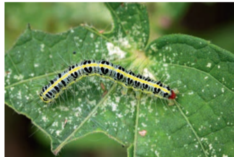
La pyrale du buis.

nant à moyen terme un dépérissement de l'arbre.