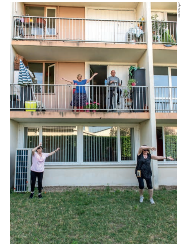
Les Ovillois gardent le sens du rythme avec une séance de gymnastique adaptée.