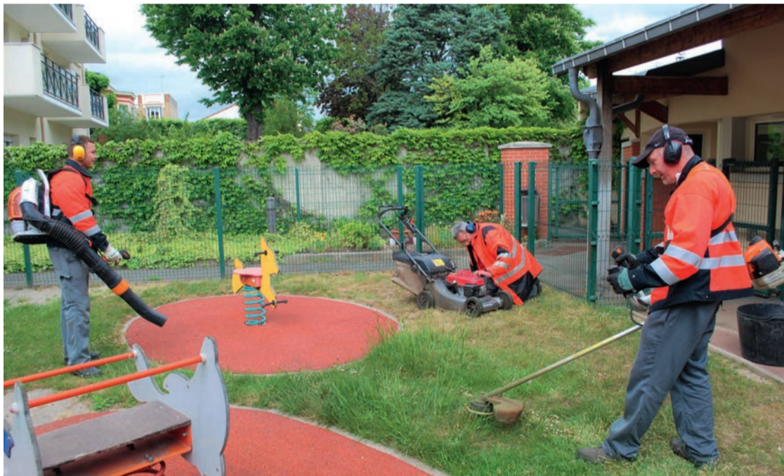
Les agents des services techniques sont mobilisés pour assurer l'entretien et la propreté des jardins et des espaces verts de la Ville.