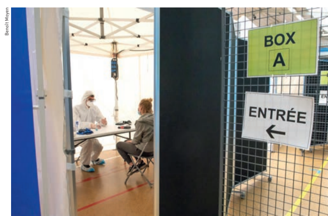
Le centre de consultation ambulatoire a été créé pour soulager les cabinets de médecine et les urgences.

Validé par l'Agence régionale de santé (ARS) ainsi que par l'Ordre des médecins et de la CPAM, le centre a élargi dès son ouverture son champ d'intervention en accueillant des patients d'autres communes de la Boucle. « Le centre de consultation ambulatoire n'est pas un centre de dépistage. Il reçoit exclusivement sur prescription médicale et sur rendez-vous, les consultations étant gratuites. À la mi-avril, 93 patients ont été reçus en consultation et ont pu bénéficier d'une prise en charge, réalisée par 38 médecins et 26 personnels infirmiers. » L'équipe, constamment présente au gymnase Ostermeyer, est composée d'un médecin, d'une infirmière, de deux bénévoles et d'un secrétariat, dont l'emploi du temps est organisé par l'ARS. ■