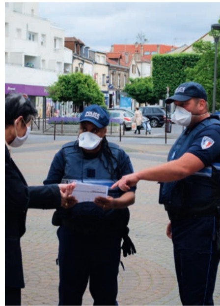
La police municipale s'assure du respect des mesures de confinement.