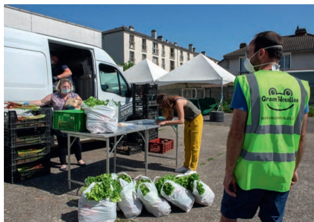
L'association Green'Houilles a lancé une opération solidaire pour soutenir les commerçants du marché et les producteurs locaux.

A fin de faire face à la crise sanitaire actuelle qui a entraîné la fermeture de l'ensemble des commerces, l'association éco-solidaire Green'Houilles a mis en place, dès le 9 avril, avec le concours de la Ville, l'opération « Commerçants et Ovillois solidaires ». Ce dispositif permet aux Ovillois de commander des produits frais auprès des commerçants du marché afin de soutenir l'approvisionnement en circuits courts et d'exprimer leur solidarité envers les producteurs locaux. Les commandes s'effectuent en ligne ou par téléphone à partir du site Internet de l'association. Des fiches détaillées de chaque commerçant précisent les modalités de commande et indiquent la marche à suivre. Les livraisons sont effectuées à domicile ou dans sept points relais de la ville (un par quartier). Les horaires des distributions, réalisées avec le