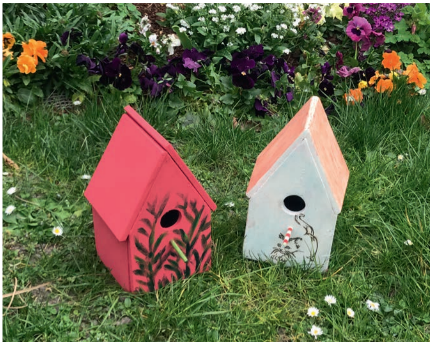
En guise de remerciement, les enfants ont reçu un nichoir à mésanges à monter et à décorer soi-même.

Tous les dessins sont visibles en ligne sur ville-houilles.fr .