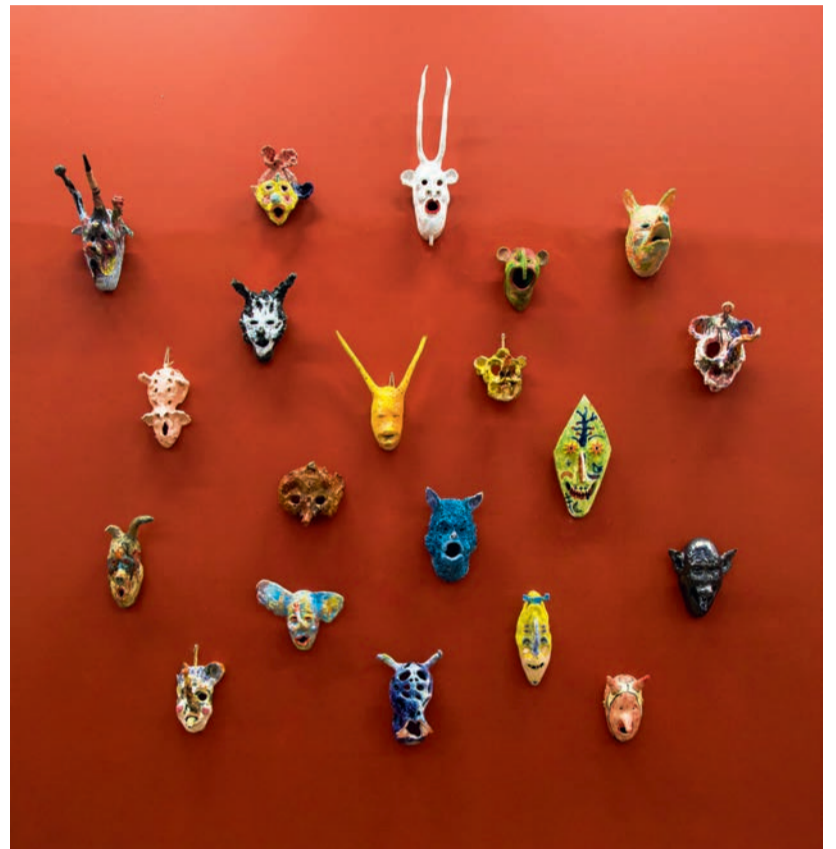
L'œuvre La Confrérie des diables de Yoann Estevenin (2018) sera exposée à l'occasion de la 13 e Biennale de la jeune création, qui commencera à partir du 19 septembre.