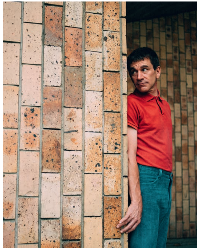
Absurde, maladroit et décalé, Monsieur Fraize jouera son dernier spectacle à Houilles, le 17 novembre.