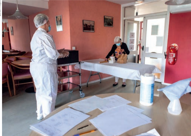
La distribution de repas aux seniors se déroule dans le respect des gestes barrières.