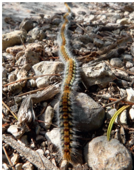
La chenille processionnaire.

La chenille processionnaire est brune avec des taches orangées. Son corps, couvert de poils urticants et allergisants pour l'homme et les animaux, peut entraîner des réactions cutanées et des troubles oculaires. Cette chenille vit dans des nids de fils de soie accrochés aux branches et se déplace en file indienne. Elle se nourrit d'aiguilles de diverses espèces de pins et de cèdres, entraî-