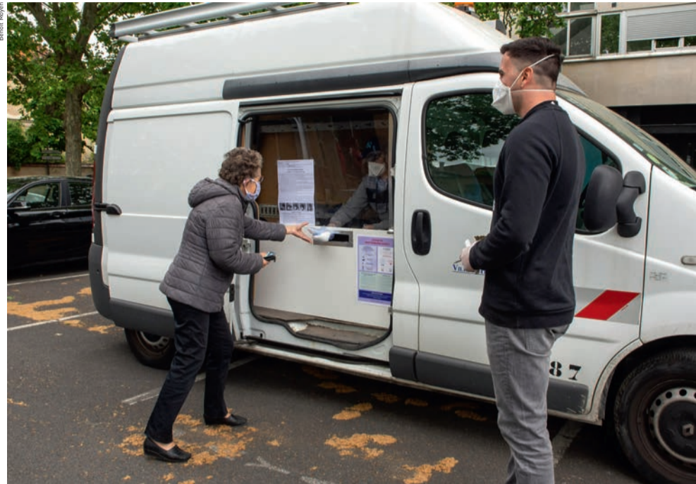
Dès le 27 avril, la Ville a distribué des masques de protection aux Ovillois prioritaires (personnes âgées ou vulnérables, en situation de handicap...).

Dès le 27 avril, et dans l'attente d'une distribution à l'ensemble des foyers ovillois, la Ville a distribué des masques de protection en priorité aux Ovillois âgés de plus de 65 ans, aux personnes vulnérables, aux personnes en situation de handicap, ainsi qu'aux femmes enceintes. Les distributions ont eu lieu du lundi au vendredi, de 15 h à 17 h 30, réparties sur divers points de la ville. Quatre masques ont été distribués par personne. Afin de respecter les mesures de distanciation et les gestes barrières, plusieurs véhicules municipaux ont été équipés d'une paroi en bois et en verre avec une ouverture – à l'image de celle d'une boîte aux lettres – afin de distribuer sans risque le matériel de protection.