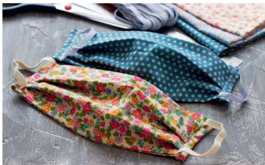
L'Association française de normalisation (Afnor) propose des tutoriels en ligne pour fabriquer soi-même des masques barrières.

Face à la pénurie de masques en France, et sachant que les stocks sont réservés en priorité aux personnels soignants, la Ville vous propose de réaliser des masques artisanaux via les tutoriels de l'Association française de normalisation (Afnor) à consulter sur afnor.org ou sur ville-houilles.fr , rubrique « Covid-19 : mesures de confinement » ou rubrique « Covid-19 : déplacements et transports ».