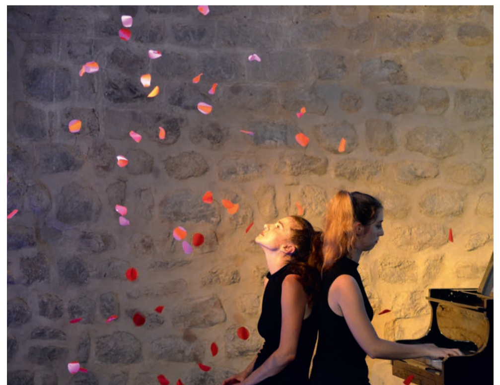
Reporté les 25 et 26 septembre, le spectacle « Cendrillon avec... ma sœur » est un étonnant voyage imaginaire mêlant musique de chambre, théâtre, art du conte et mélodrame.

La Graineterie vous contactera par courriel (ou par téléphone le cas échéant), au plus tôt à la réouverture, pour vous informer de la date à partir de laquelle vous pouvez venir récupérer votre remboursement. Les personnes en possession de leurs billets devront les restituer en échange du chèque correspondant au montant de la commande ; il est donc important de bien les conserver. Si vous n'aviez pas retiré votre commande, l'équipe de la Graineterie se charge de fournir le billet original. Seule la personne ayant réalisé la commande (et le paiement) peut prétendre au remboursement. ■