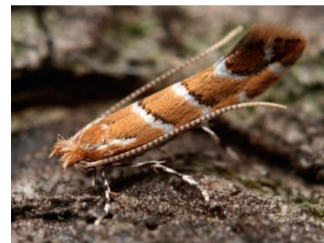
La mineuse du marronnier.

Retrouvez les dates des campagnes préventives sur ville-houilles.fr