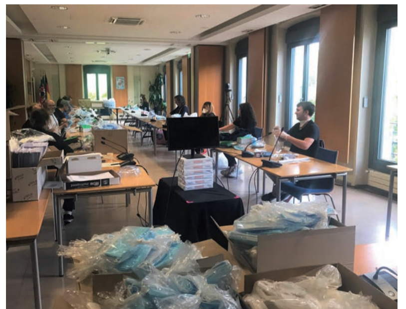
Les agents préparent en mairie le matériel de protection qui est distribué depuis fin avril aux personnes prioritaires (personnes âgées ou vulnérables, en situation de handicap...).