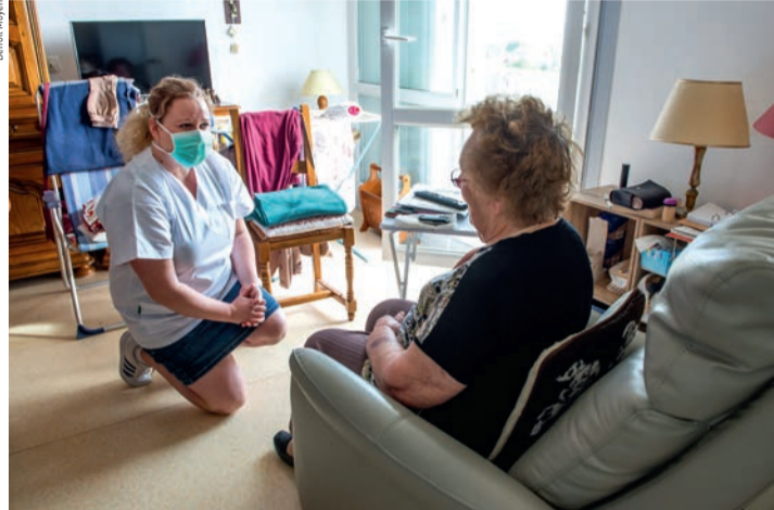
Le service de soins infirmiers à domicile continue ses visites pendant la période de confinement.