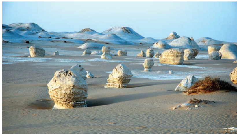
Le désert libyque, situé dans l'ouest de l'Égypte.

Au-delà du Nil, berceau des civilisations, l'Égypte n'est que déserts. Le film documentaire de Dany Marique Déserts d'Égypte suit les traces des migrations humaines vers l'eau, à l'origine de la naissance de l'Égypte pharaonique. Chemin de l'Exode, le désert du Sinai fut exploité par les Pharaons pour sa turquoise. Aujourd'hui encore se dresse en ces lieux arides le monastère de Sainte-Catherine situé au pied du mont Horeb où, selon l'Ancien Testament, Moïse aurait