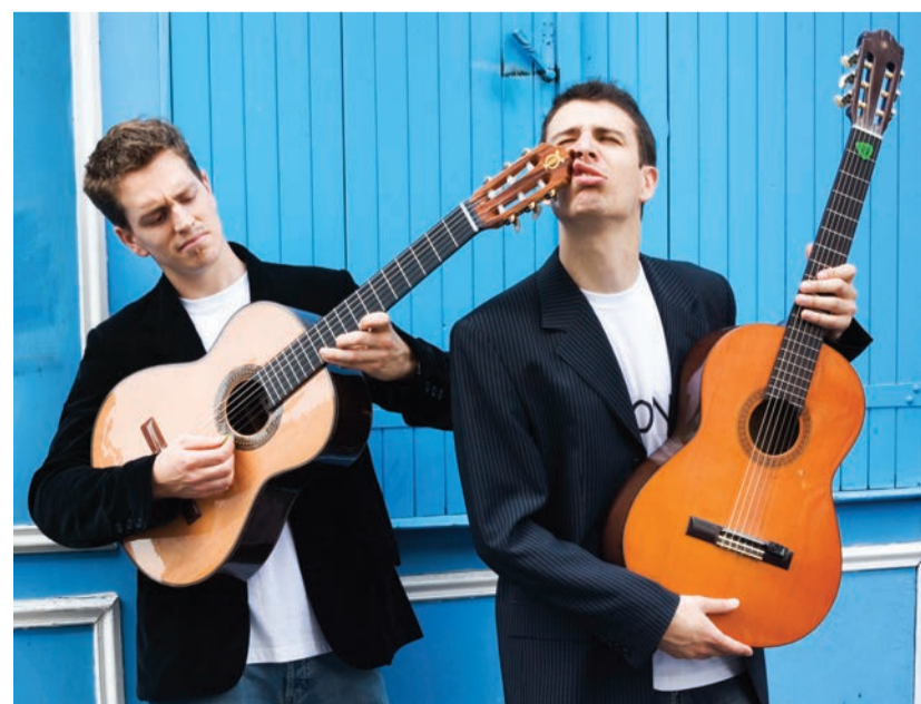
Les deux guitaristes Piki et Piki.

Samedi 15 octobre à 14 h 30. Pour adultes et enfants dès 8 ans (gratuit sur inscription). Médiathèque Jules-Verne (7, rue du Capitaine-Guise). Renseignements et inscriptions : 01 30 86 21 20.