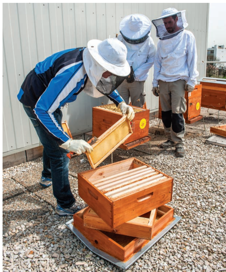
Récolte du miel du rucher municipal.