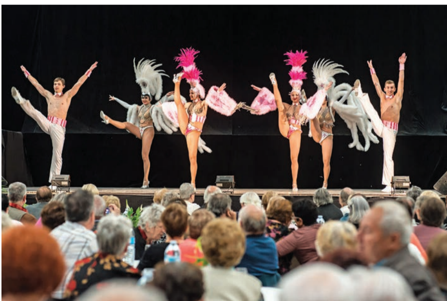
Spectacle de l'amitié à l'espace Ostermeyer.

Vous avez 65 ans et plus ? Le Spectacle de l'amitié, que la Ville organise chaque année, vous est tout particulièrement destiné. Cette année, ce rendez-vous festif et convivial se déroulera, le dimanche 16 octobre, à 14 h 30, à l'espace Ostermeyer. Au programme : un spectacle tout en musique et en danse, agrémenté d'un