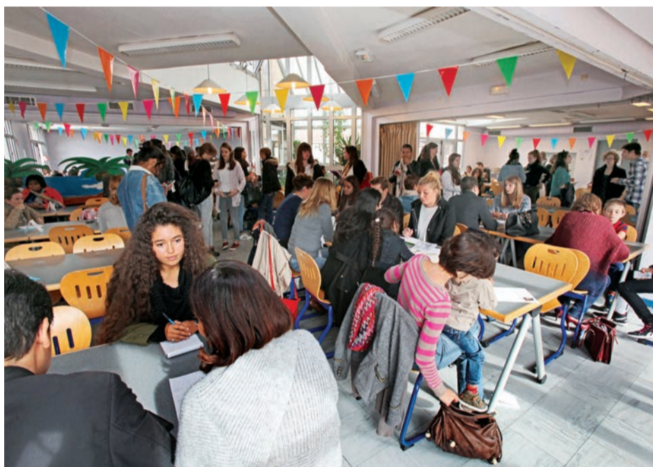
Rencontre « baby-sitting dating » au centre Jacques-Yves-Cousteau.

Vous êtes parents à la recherche d'un baby-sitter ou étudiant à la recherche d'un emploi à temps partiel ? Ne manquez pas la prochaine édition du « baby-sitting dating ».