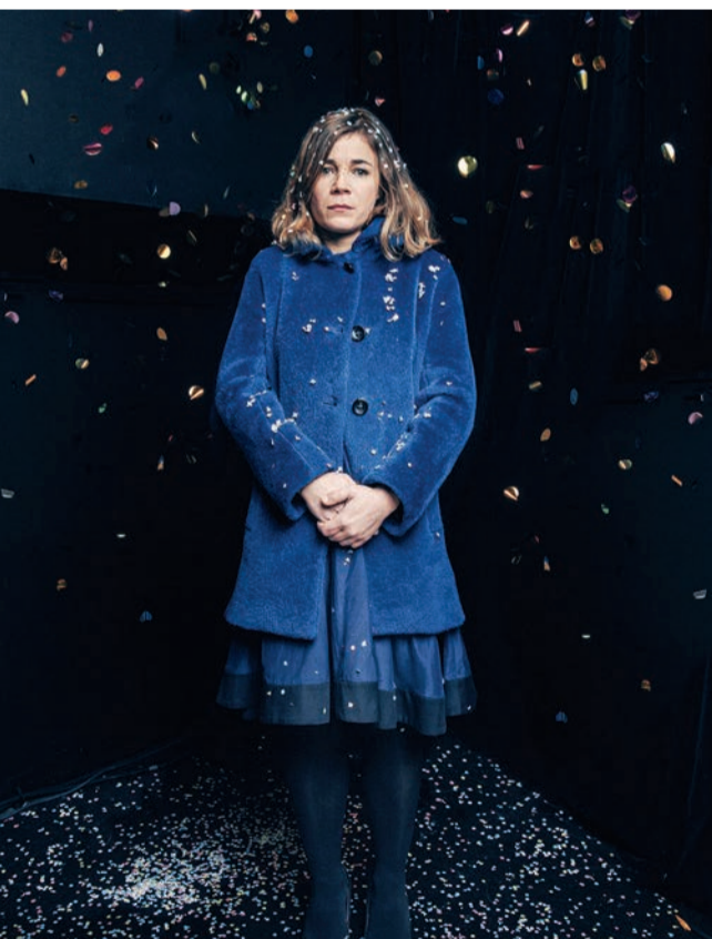
Blanche Gardin offre un show drôle et décapant.

Un ton totalement libre, une vision du monde bien particulière, beaucoup d'humour noir et un sens de la dérision développé. Prenez le tout, mélangez vivement et vous obtenez le nouveau stand up de Blanche Gardin : « Je parle toute seule », sur la scène de la salle Cassin le 14 octobre. Après son premier spectacle, « Il faut que je vous parle », en 2014, l'artiste est de retour sur scène pour un show