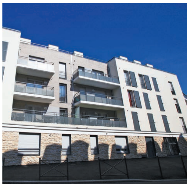
Au 1 er janvier 2015, la Ville de Houilles disposait d'un parc social de 1 788 logements.

Chaque logement est identifié par un numéro d'identité et inscrit au sein d'un fichier appelé « RPLS » (répertoire du parc locatif social). À ce numéro correspond un réservataire. Quand un logement se libère, l'organisme HLM propriétaire prévient le réservataire concerné, pour qu'il propose trois candidats. Disposer d'un contingent ne veut pas dire imposer des locataires à l'organisme HLM, propriétaire de l'immeuble. L'attribution d'un logement à un demandeur se fait en concertation entre