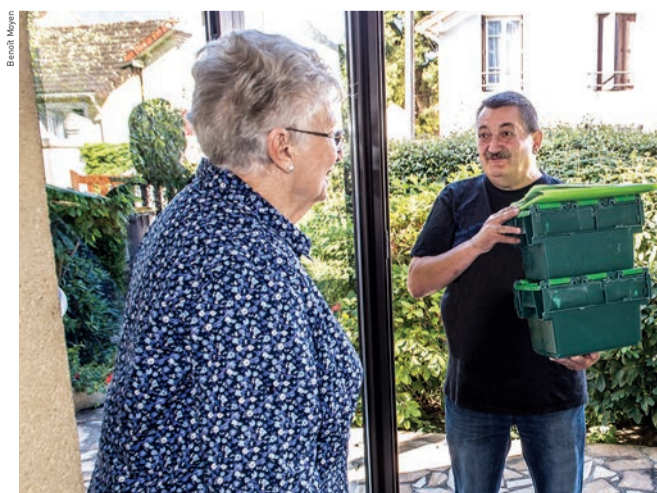
Portage de repas à domicile.

handicapées peuvent faire appel au service de soins infirmiers à domicile (SSIAD) de la Ville. Dans le cadre de sa mission, une équipe d'aides-soignantes et d'infirmières assure au domicile des patients des soins d'hygiène et de confort. Pour bénéficier de ces prestations, il faut s'adresser au centre communal d'action sociale (CCAS). En fonction de l'autonomie de la personne, une demande de prise en charge sera adressée au conseil départemental ou à la caisse de retraite du bénéficiaire. Après accord, un responsable du service de maintien à domicile rendra visite à la personne pour définir avec elle la nature, la fréquence et la durée des interventions. Par la suite, la prise en charge pourra évoluer en fonction de la situation individuelle de la personne.