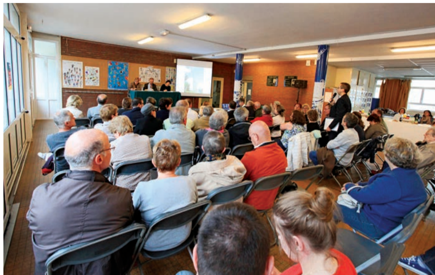
Réunion publique, en mai dernier, du quartier Les Belles-Vues.

Les réunions de quartier sont un élément moteur de la démocratie locale. Organisées au rythme d'une rencontre par an, dans chacun des sept quartiers de la commune, elles permettent aux Ovillois d'être informés sur les grands projets de la Ville et de débattre des questions relatives à leur vie quotidienne. Prochaine rencontre, le mercredi 30 novembre, pour les habitants des quartiers Les Pierrats et Le Tonkin.