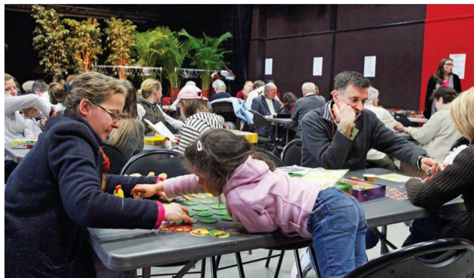
Rencontre autour des jeux de société à la salle Cassin.

Le centre communal d'action sociale (CCAS) propose une rencontre intergénérationnelle, le 26 octobre, salle Cassin, autour des jeux de société. Enfants, adolescents, adultes, seniors et familles sont les bienvenus pour partager ce moment en toute convivialité.