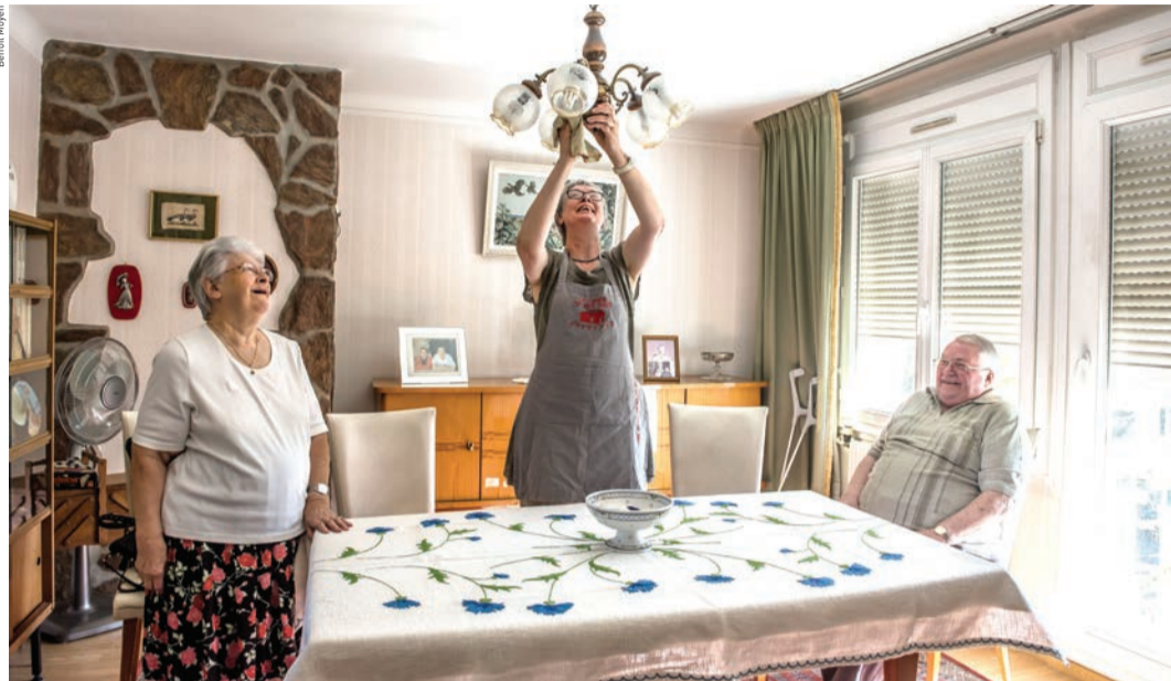
Le centre communal d'action sociale (CCAS) constitue l'un des principaux acteurs de l'action sociale. Ses domaines de compétences sont variés : service de maintien à domicile, instruction des demandes d'aides sociales légales, animations et loisirs...

L'action sociale dans son ensemble est mise en œuvre par trois acteurs : le département, chef de file de l'action sociale, les communes et les associations. À Houilles, elle est conduite par le centre communal d'action sociale (CCAS) dans le cadre de partenariats associatifs et institutionnels.