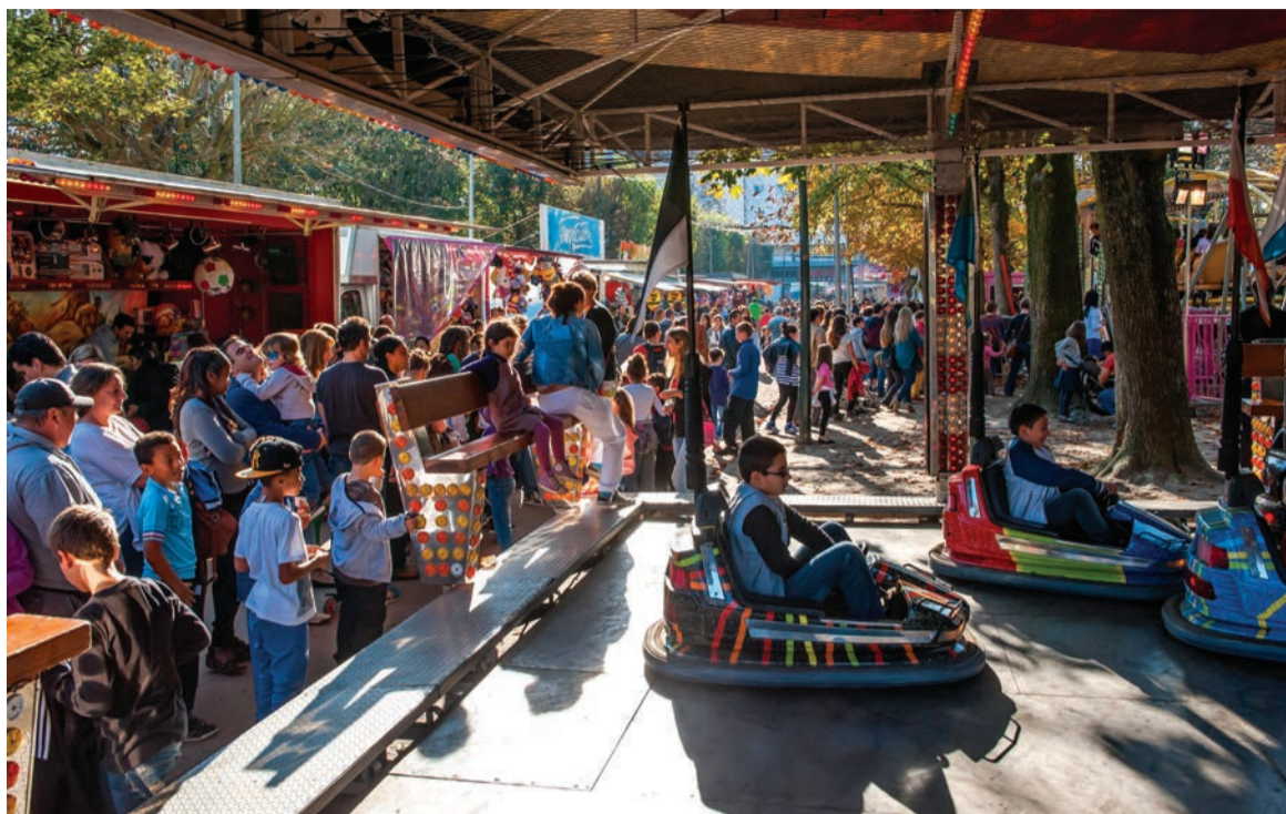
Fête foraine des enfants dans le parc Charles-de-Gaulle.

> « La mini-ferme de Tiligolo », un spectacle clownesque qui met en scène des animaux de basse-cour (poussins,