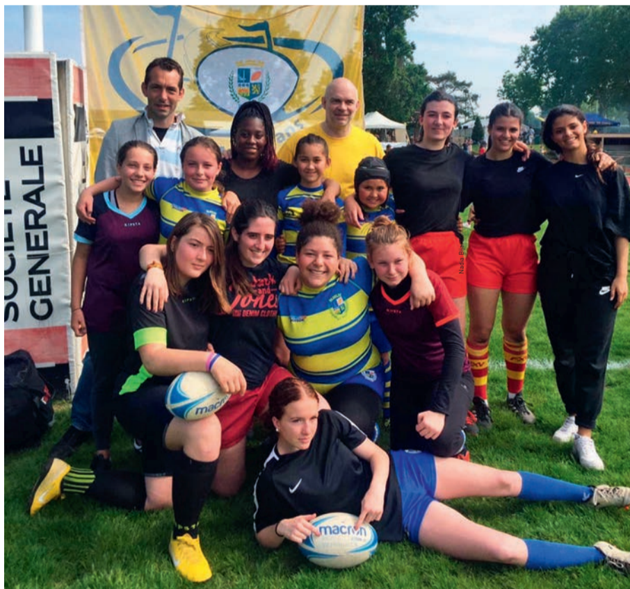
L'équipe féminine de rugby des moins de 18 ans du ROC HC.