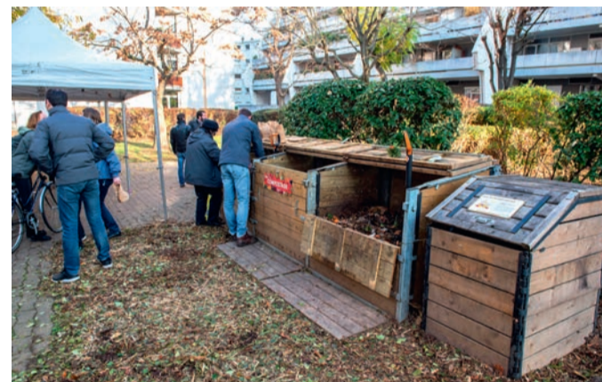
Site de compostage partagé dans la résidence Genêts-Pharaons.

À Houilles, la pratique du compostage gagne chaque jour du terrain. Aujourd'hui, 1064 foyers individuels ovillois sont équipés en composteurs, soit un taux d'équipement de 16,39% des logements. Un pourcentage qui prend en compte les seuls composteurs distribués par la communauté d'agglomération Saint-Germain-Boucles-de-Seine (CASGBS), lors des campagnes de dotation qu'elle organise deux fois par an dans notre commune. Dans l'habitat collectif, les sites de compost partagés sont aussi en progression. Après les résidences Chanzy et Genêts-Pharaons, la résidence Victor-Hugo a rejoint le dispositif en début d'année 2019. En tout, quelque 790 foyers ont maintenant recours au compostage collectif. Une action qui s'est traduite, l'an dernier, par la valorisation de 12,8 tonnes de déchets organiques. En marge de ces initiatives, le service de l'environnement de la Ville a implanté des composteurs dans deux stades de la commune (Robert-Barran et Maurice-Baquet) et les écoles ovilloises organisent chaque année des ateliers et des animations autour du compostage à destination des enfants. Le compostage permet de diminuer de 30% le poids de nos ordures ménagères (soit entre 45 et 60kg/hab./an) et de réduire la production et la collecte de déchets verts.