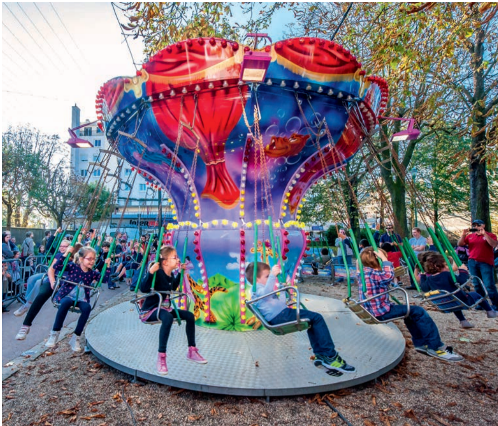
Le parc Charles-de-Gaulle accueille, du 12 au 27 octobre, la Fête foraine des enfants.

La Fête foraine des enfants s'invite dans le parc Charles-de-Gaulle. Deux semaines durant, du 12 au 27 octobre, les enfants de moins de 12 ans pourront profiter d'une vingtaine d'attractions proposées à leur intention. Au programme de cette nouvelle édition : dix grands manèges (autos tamponneuses, trampoline élastique, bulles aquatiques, chaises volantes, toboggan géant, petit train...), des attractions et des jeux d'adresse avec leur cortège de lots à gagner (billard japonais, tir à l'arbalète, jeux d'adresse, tir aux ballons...), sans oublier les stands de confiseries.