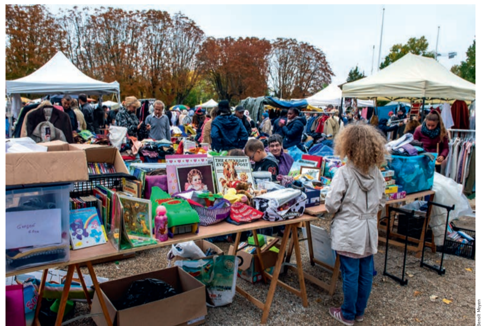
La traditionnelle braderie de Houilles est placée sous le signe de l'économie circulaire et de la mobilité douce.

L'incontournable braderie de Houilles est de retour le dimanche 6 octobre. Cet événement, à mi-chemin entre le vide-grenier et la brocante, attire un public varié qui mêle simples curieux, chineurs, brocanteurs et antiquaires. Nouveauté cette année : l'espace dévolu à la braderie est étendu au-delà du périmètre du parc Charles-de-Gaulle, offrant près de 1 600 emplacements réservés aux particuliers, aux professionnels, et avec plus de 80 emplacements consacrés à la puériculture. Cette 46 e édition, organisée par le Comité des fêtes et l'Unova en partenariat avec la Ville, sera placée sous le signe de l'économie circulaire et de la circulation