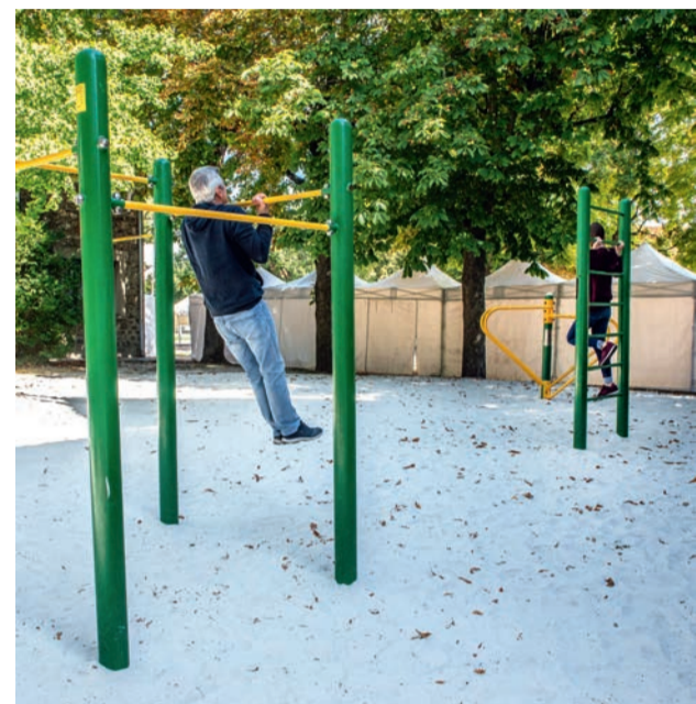
Agrès fitness dans le parc Charles-de-Gaulle.