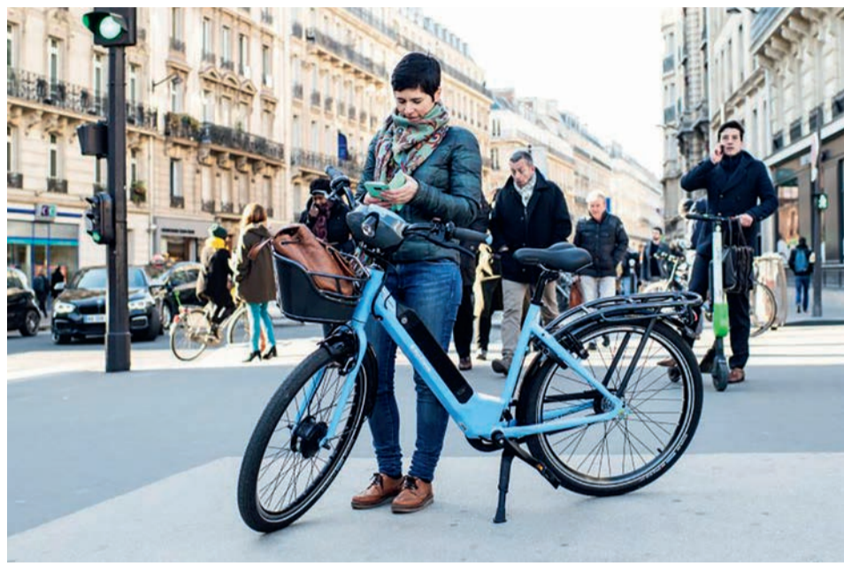
Le nouveau service Véligo Location permet de louer des vélos à assistance électrique dans toute l'Île-de-France.

Véligo Location est un nouveau service proposé par Île-de-France Mobilités dans le cadre du plan de développement de l'usage du vélo dans les trajets du quotidien. Près de 10 000 vélos sont désormais mis en libre-service et disponibles à la location longue durée dans toute l'Île-de-France. Grâce à un système d'abonnement, les Franciliens peuvent louer des vélos à assistance électrique dans plus de 250 points de location en s'appuyant sur les bureaux et centres de courrier du groupe La Poste, les stationnements Urbis Park, des enseignes de distribution et des vélocistes indépendants.