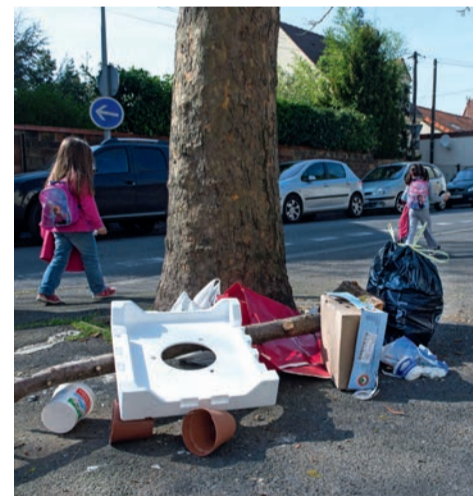
Le responsable d'un dépôt sauvage peut faire l'objet d'une amende.

Les déchets de toute nature peuvent être acheminés à la déchetterie du Sitru (1, rue de l'Union, Carrières-sur-Seine), ouverte tous les jours (www.sitru.fr). ■