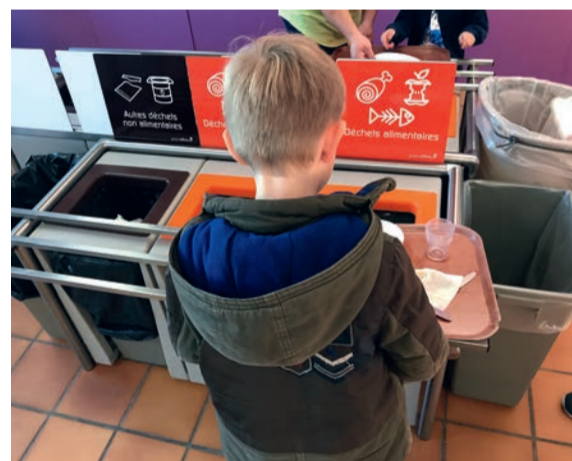
Tri des biodéchets au self de l'école Félix-Toussaint.

Les écoliers ovillois trient leurs biodéchets dès la maternelle ! Depuis mai dernier, les déchets alimentaires des 18 sites de restauration scolaire triés par les enfants sont récupérés par une