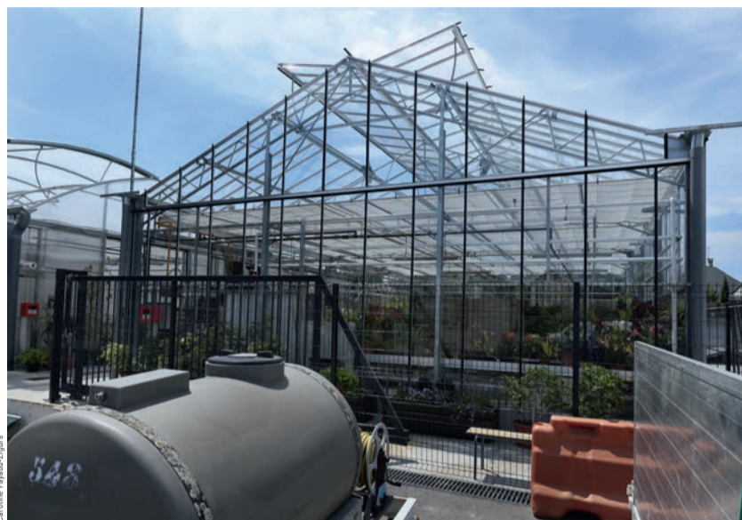
Arrachage mécanique des mauvaises herbes le long des trottoirs par les agents municipaux (à gauche). Cuve de récupération d'eau de pluie utilisée pour l'arrosage des arbres et des massifs floraux de la commune (à droite).

S elon les projections et prévisions, la planète ne supportera pas longtemps encore l'augmentation de la consommation au rythme actuel. Les ressources naturelles ne peuvent plus suivre la cadence effrénée des activités humaines.