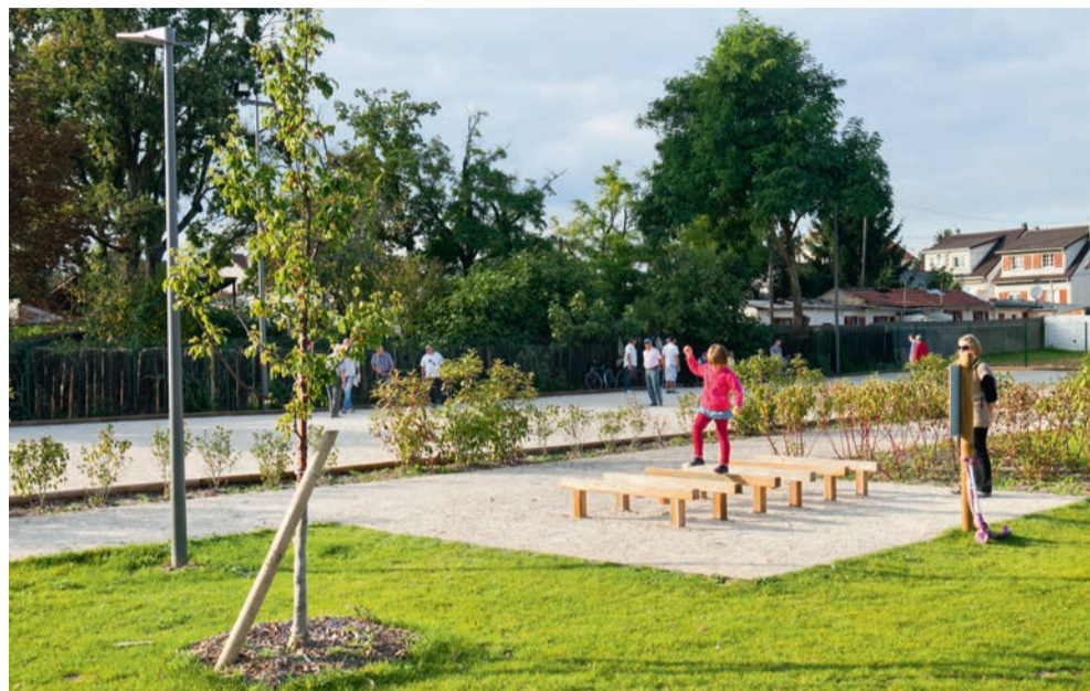
Parcours sportif de l'espace Jemmapes.

Le fitness urbain et ses équipements ludo-sportifs investissent l'espace public. Un moyen pour les villes d'encourager la pratique du sport pour tous et d'aménager leur territoire en cohérence avec le développement d'espaces