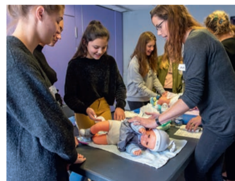
Atelier de baby-sitting au Ginkgo.

S'occuper des enfants comme baby-sitter demande des connaissances au préalable. Dans cette perspective, le ser-