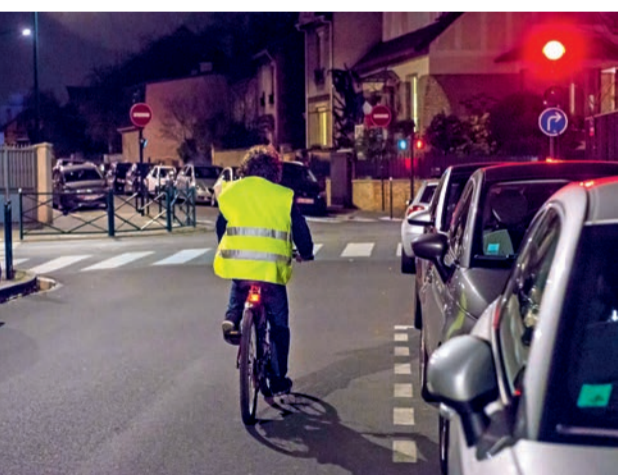
À vélo, être vu des autres usagers est essentiel pour sa sécurité.

En automne, les jours plus courts et l'obscurité en fin de journée augmentent le risque d'accidents pour les cyclistes. La cause est essentiellement due à une insuffisance, voire à un manque total, d'équipement de visibilité. Dans près d'un accident sur trois, le cycliste est heurté par l'arrière par un automobiliste qui déclare ne pas l'avoir vu. Être vu des autres usagers est donc essentiel pour améliorer sa propre sécurité. Pour être davantage visible, le cycliste peut porter un gilet muni de bandes