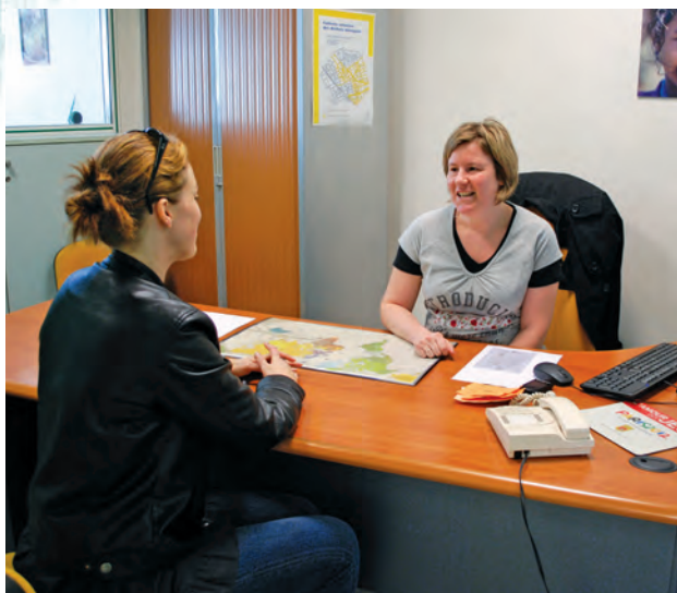
Des permanences juridiques sont proposées gratuitement par la Ville. Ci-dessus : permanence du conciliateur de justice.

G âce aux permanences juridiques proposées gratuitement par la Ville, les Ovillois peuvent bénéficier d'une consultation personnalisée avec un conseiller juridique, un avocat ou un conciliateur de justice.