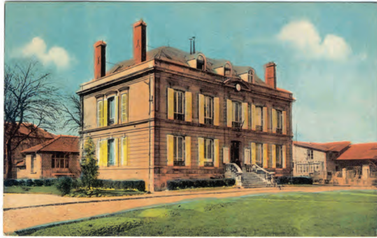
Hôtel de ville.