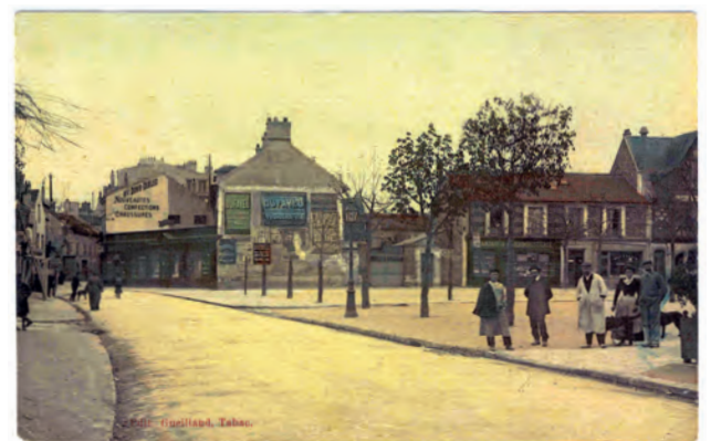
Place Michelet et rue de Paris (actuellement rue Gabriel-Péri).

Les cartes postales sont issues des collections des archives municipales.