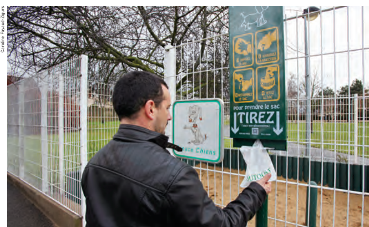
Sept distributeurs de sacs canins ont été installés à proximité de canisites. Ci-contre : site du parc Victorien-Chausse.

C' est nouveau ! Sept distributeurs de sacs de ramassage de déjections canines ont été installés, mi-janvier, par le service de l'environnement dans différents lieux de la ville, le plus souvent à proximité des canisites. Auparavant, les sacs de ramassage n'étaient disponibles qu'à l'accueil de l'hôtel de ville et à celui de la direction des services techniques. Ces nouveaux équipements contribueront ainsi à faciliter la vie des maîtres et à garantir une plus grande propreté de notre ville car, en milieu urbain, les déjections canines sur la voie publique constituent encore une source de pollution.