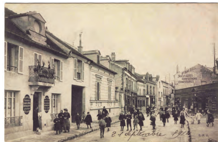
Rue de Paris (actuellement rue Gabriel-Péri).

Houilles sous l'Occupation. Le 2 septembre 1939, la mobilisation générale est décrétée. L'application du plan de la défense passive mis en place dès août 1935 est enclen-