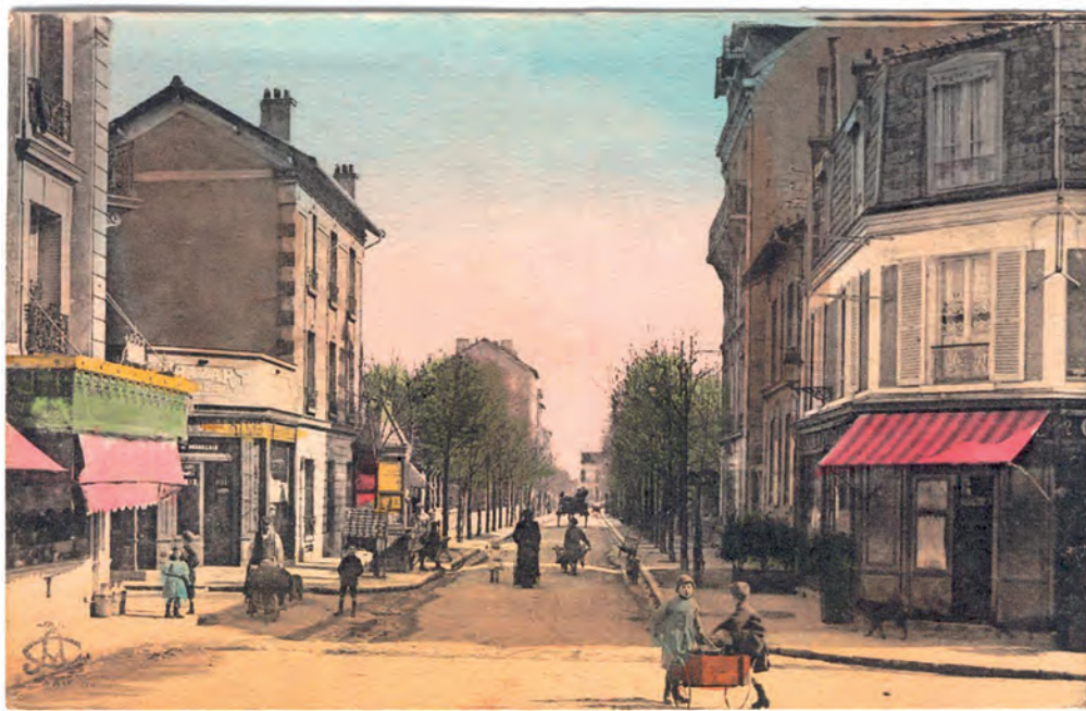
Avenue de la Gare.

À la fin du XIX e siècle, Houilles s'est délibérément tournée vers Paris. La population s'accroît d'un grand nombre de provinciaux qui « montent » à Paris dans l'espoir d'y trouver une vie meilleure. Le formidable bond démographique de ce début de siècle va être l'élément déterminant de l'évolution de Houilles. Malgré l'intermède sanglant de la Grande Guerre dont Houilles sort meurtrie (plus de 300 Ovillois ne reviendront pas), la population triple entre 1900 et 1920.