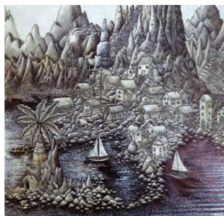
Les Calanques (dessin au stylo bille), de Stéphanie Dhollande : 1 er prix du public toutes catégories du Salon des artistes locaux.

Dans le cadre du Salon des artistes locaux, qui s'est tenu en décembre dernier, trois prix ont été décernés. Ils viennent récompenser des œuvres exposées et ainsi valoriser la création locale. Le Prix de la Ville est attribué par un jury composé d'élus municipaux et d'artistes professionnels lors du vernissage. L'œuvre primée est acquise par la municipalité. Le Prix du public traduit le « coup de