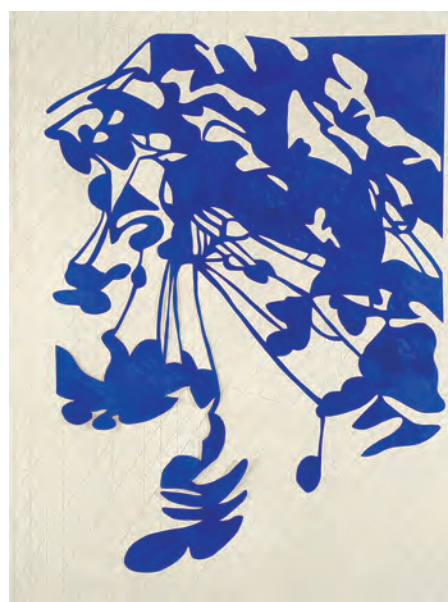
Feuiller (acrylique sur papier) de Frédérique Lucien.

La Graineterie (27, rue Gabriel-Péri). Tél. : 01 39 15 92 10. lagraineterie.ville-houilles.fr