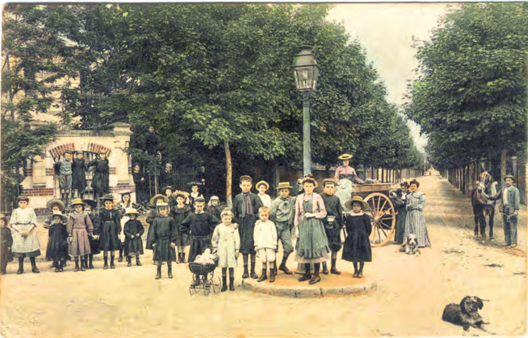
Avenue de la République.