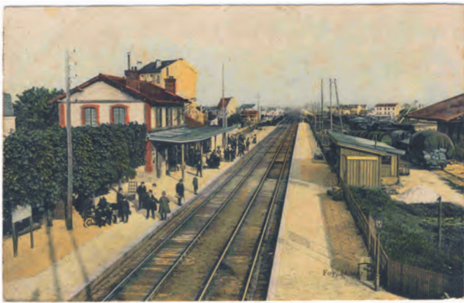
Gare de Houilles.

tionnées pour loger les soldats du contingent du génie maritime allemand.