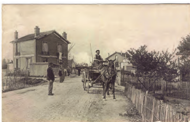
Rue des Blanches.

chée. Le lendemain, la France entre en guerre contre le III e Reich. Le 5 septembre, la sirène hurle pour annoncer la première alerte à Houilles. On ne parle plus que de « masques à gaz », de « camouflage des lumières » et d'« abris ». Quelques jours plus tard apparaît la première restriction sur la vente du pain, rapidement suivie par celle sur la vente et la consommation de viande. Début 1940, le gouvernement instaure le système des cartes d'alimentation. Le 13 juin 1940, Houilles s'est vidée de sa population qui a rejoint les flots de l'exode. Dix jours auparavant, la région parisienne avait subi ses premiers bombardements. Après la signature de l'armistice, les Ovillois regagnent petit à petit leur foyer, mais il faut faire face à la triste réalité : les Allemands sont bel et bien à Houilles et réquisitionnent logements, denrées et matières premières. Ils installent dans les carrières aménagées avant-guerre par Hispano-Suiza un chantier de fabrication de torpilles sous-marines et de V2. De plus, 60 maisons sont réquisi-