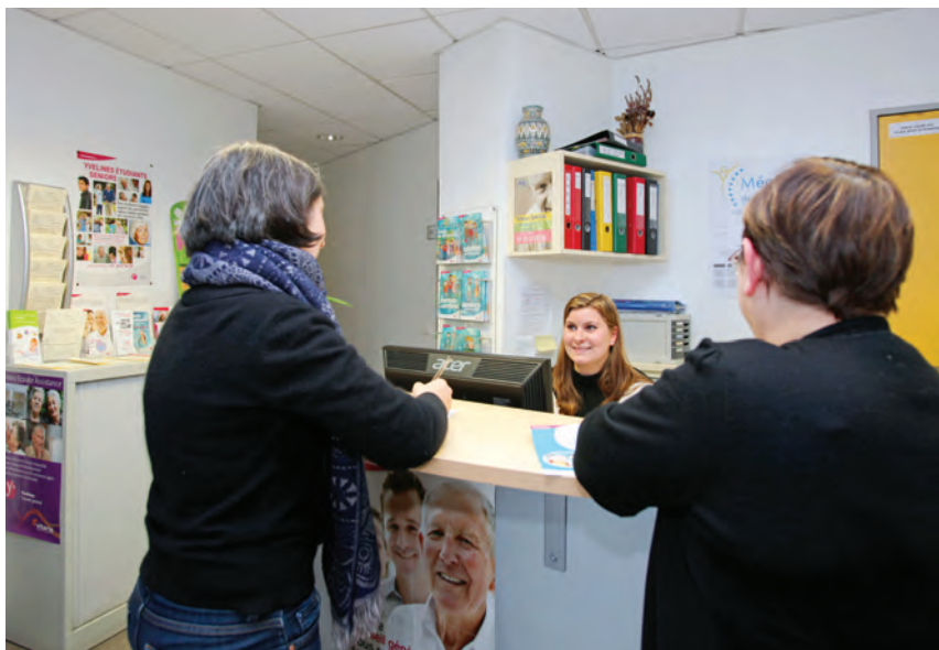
Accueil de la coordination gérontologique Méandre de la Seine.

Méandre de la Seine (20, place Michelet, Houilles). Accueil : lundi, mercredi, jeudi et vendredi de 8h30 à 12h et de 13h30 à 17h30 (le vendredi à 17h); mardi de 13h30 à 17h30. Tél. : 01 30 86 93 89.