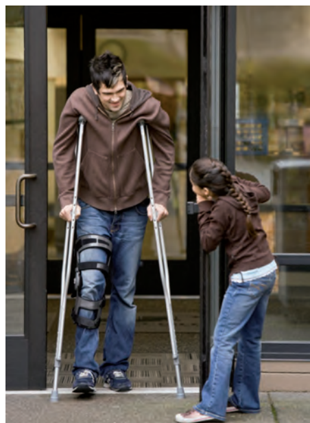
Les établissements recevant du public doivent être en mesure d'accueillir les personnes à mobilité réduite.

La loi votée le 11 février 2005 pour l'égalité des droits et des chances prévoit que le 1 er janvier 2015 tous les établissements recevant du public (ERP), dont les commerces, doivent être en mesure d'accueillir les personnes à mobilité réduite et celles en situation de handicap, quelle que soit la nature de celui-ci (moteur, visuel, auditif, mental). Cela implique pour nombre de commerces une remise aux normes de leur boutique. Les principaux points d'accessibilité à trai-