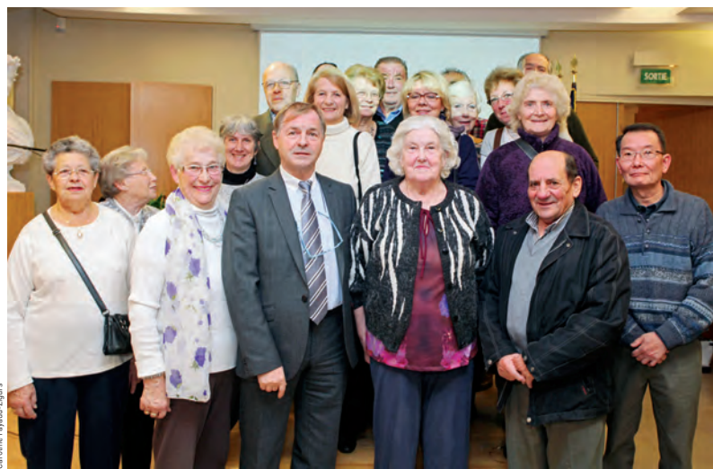
Les lauréats du concours « Maisons et balcons fleuris » lors de la remise des prix à l'hôtel de ville en décembre dernier.

Chaque année, au printemps, de nombreux Ovilleois participent au concours « Maisons et balcons fleuris » qui récompense des actions de fleurissement menées par les habitants. Le temps d'un été, les participants contribuent ainsi à l'embellissement de la commune. Coin de jardin, balcon, rebord de fenêtre, jardin potager ou partie commune de résidences, le moindre endroit trouve grâce aux yeux des plus passionnés.