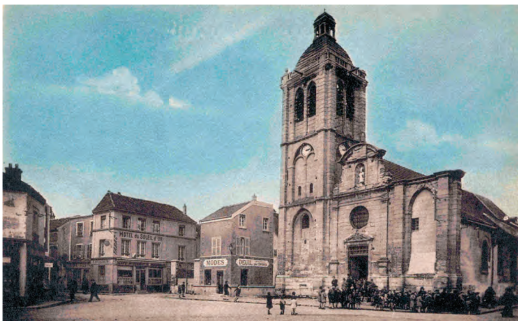
Place de l'Église.