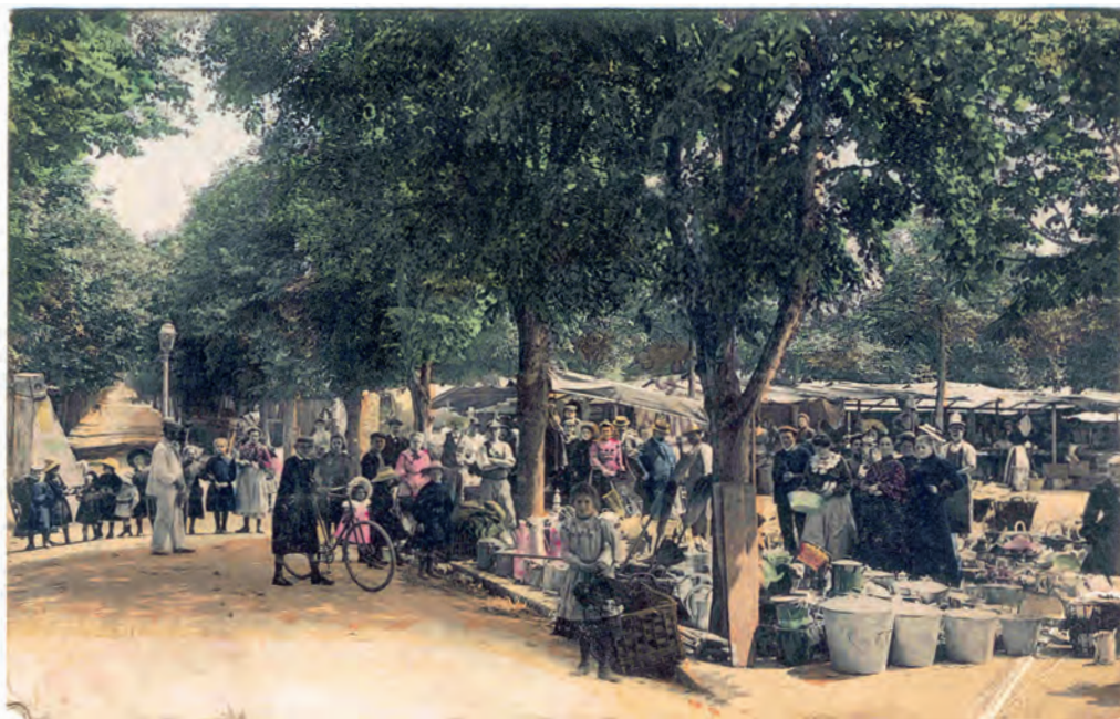
Jour de marché, avenue du Parc (actuellement avenue du Maréchal-Foch).