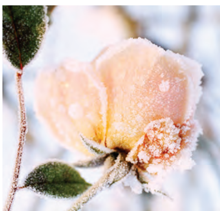
Durant l'hiver, les plantes doivent être isolées du froid.

L es jardiniers du service des espaces verts de la Ville font régulièrement partager, dans les pages de L'Ovillois , leur expérience et leurs connaissances sur un thème différent. Ce volet concerne la protection des plantes de nos jardins face à la rigueur de l'hiver. Certaines plantes ont en effet besoin d'être protégées de la chute des températures, du vent ainsi que de l'excès d'humidité. Le but est alors le même pour toutes les plantes : les isoler du froid, tout en leur assurant une aération suffisante.