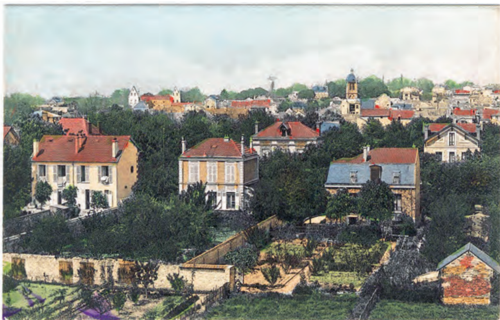
Vue générale de Houilles.

Au début du XX e siècle, Houilles est un petit village rural de la Boucle de Montesson. Aujourd'hui, c'est l'une des principales villes des Yvelines. Retour sur les principales étapes de son évolution au cours du siècle dernier.