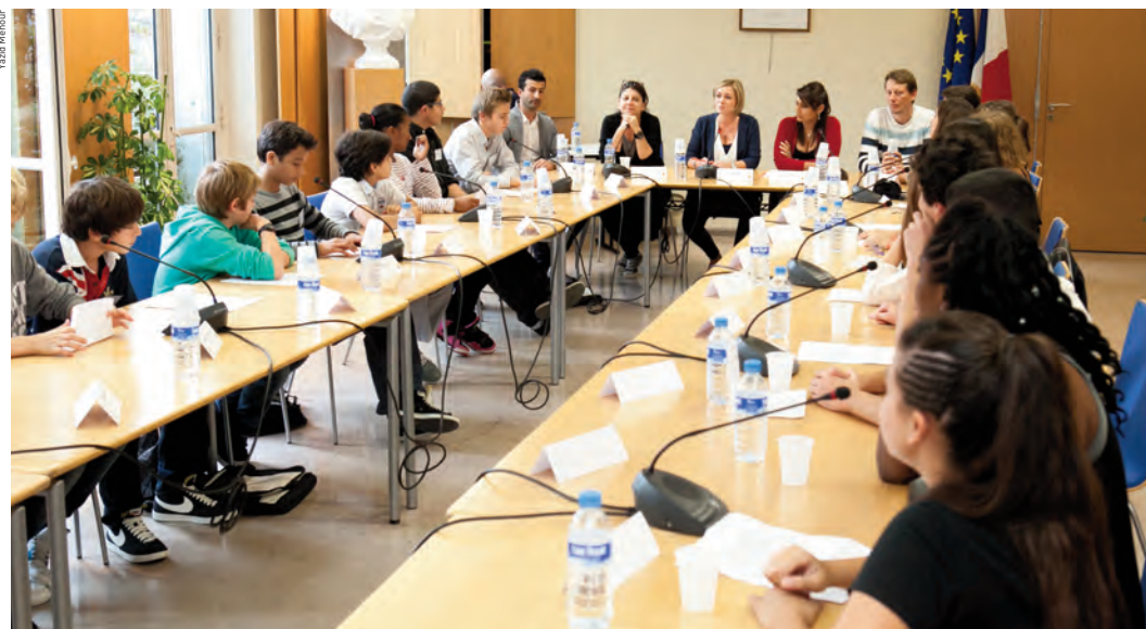
Le conseil municipal de jeunes permet de mettre en œuvre une grande variété d'actions citoyennes. Ci-contre : séance plénière à l'hôtel de ville.