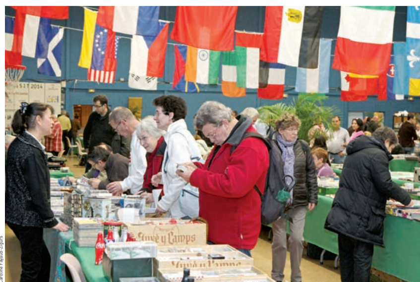
Le Salon international de la télécarte accueille plus de 70 exposants venus de 35 pays.

Entrée 2€ (ou 3€ pour les 2 jours). Gratuit le dimanche après-midi. Espace Ostermeyer (16, rue Louise-Michel).