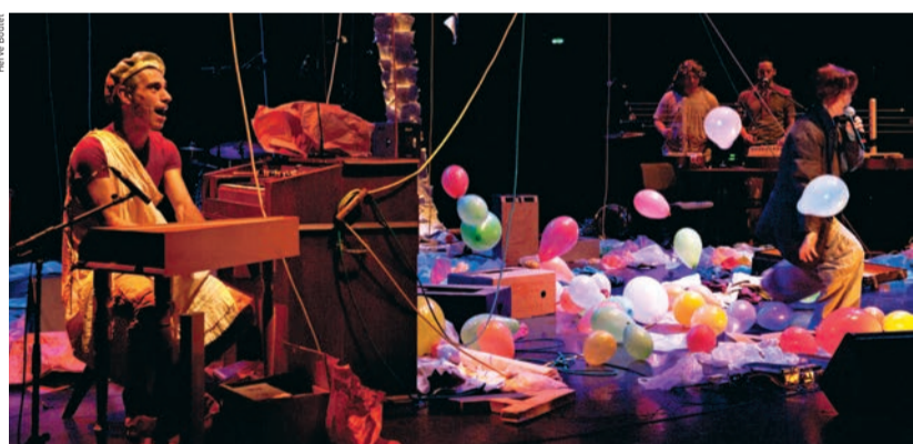
La Rasbaïa, un joyeux bazar à découvrir en famille.

U n concert festif où la bonne humeur est garantie! C'est ce que réserve La Rasbaïa, le 10 janvier, sur la scène de la salle Cassin pour un spectacle qui s'adresse tout particulièrement au jeune public. Quatre chanteurs musiciens inspirés offriront des ballades folks, des blues languoureux mêlés à des rocks loufoques, où humour et poésie éclairent leur parole acérée sur le monde. Évoluant dans un décor fait d'objets hétéroclites et d'instruments de musique étonnants, ils provoquent un salutaire désordre, mêlant moments poétiques et joyeux, chaos sonores et visuels. Harmonium, épinette, guitare électrique, tuba, batterie et objets sonores donnent un ton acoustique et rock artisanal à un voyage percutant et réjouissant. Un joyeux bazar à découvrir en famille!