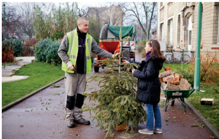
Opération de recyclage des sapins de Noël.

Grâce à cette collecte, les arbres collectés pourront être transformés en compost pour devenir un fertilisant 100 % naturel qui sera utilisé pour les parterres municipaux. Les sapins floqués ou en plastique, quant à eux, doivent être déposés lors de la collecte des ordures ménagères (bac gris) ou apportés à la déchetterie (1, rue de l'Union) à Carrières-sur-Seine. ■