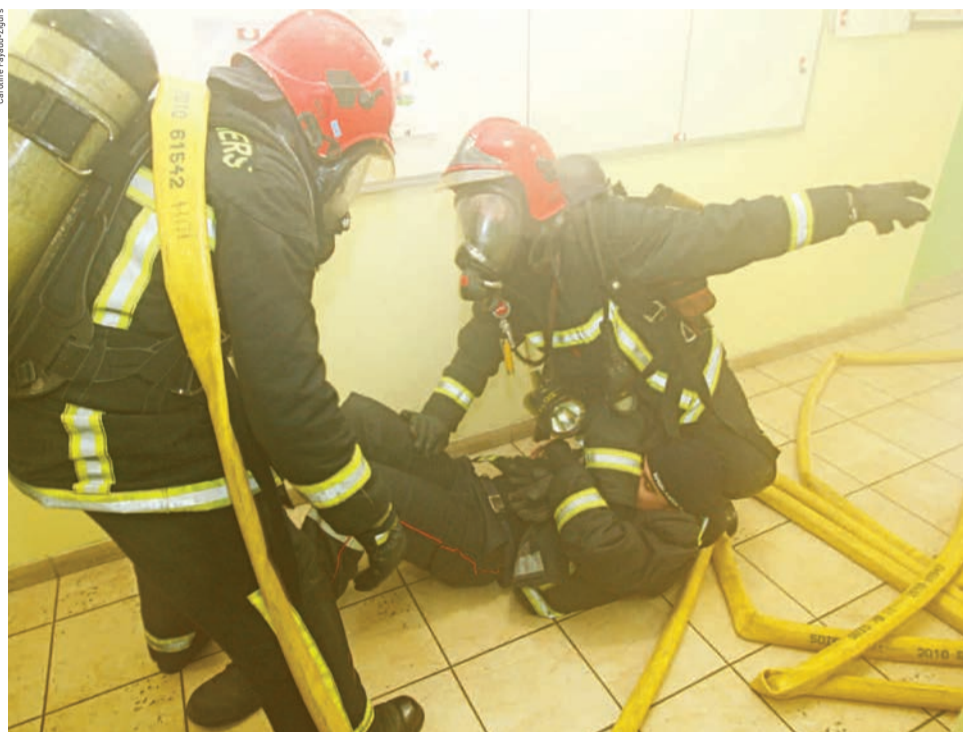
Les sapeurs-pompiers volontaires assurent les mêmes missions que les professionnels.