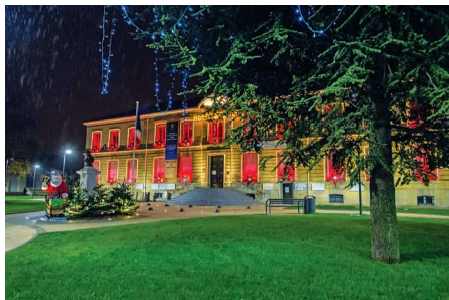
Illuminations du parvis de l'hôtel de ville.

Le parvis de l'hôtel de ville accueille, jusqu'au 15 janvier, les traditionnels décors de Noël pour le plaisir des passants, notamment des plus jeunes. Ce petit univers paysager, réalisé par le service des espaces verts et les ateliers municipaux, métamorphose les lieux à la nuit tombée. Cet ensemble, composé de sapins floqués, d'étoiles filantes et de guirlandes, ainsi que