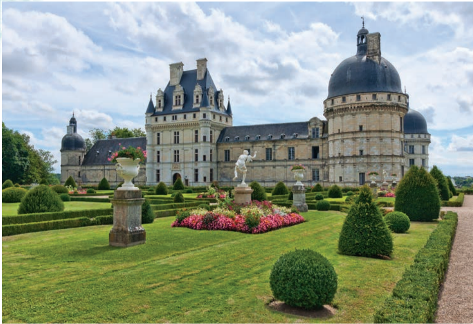
Château de Valençay (Indre).

Le centre communal d'action sociale (CCAS) propose, chaque année, un séjour dans une région de France, destiné aux Ovillois âgés de 60 ans et plus. Le prochain séjour aura lieu à Valençay (Indre), du 1 er au 6 juin, dans une résidence hôtelière, au cœur des pays de la Loire. Les inscriptions pour participer à ce séjour se feront à partir du 19 janvier. Au programme : les châteaux de Chambord et de Cheverny, visite d'une faïencerie à Parpeçay, découverte de Loches, la ville Renaissance, et de la demeure de George Sand, à Nohant, promenade en bateau sur le Cher... Les visites sont adaptées aux personnes éprouvant des difficultés à se déplacer.