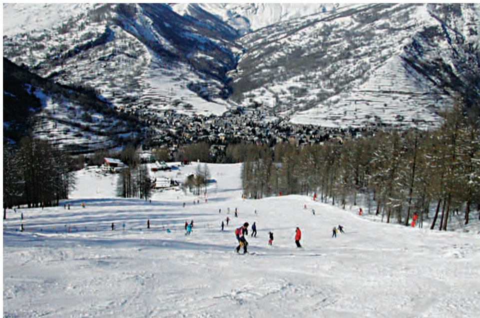
Ski alpin, surf et jeux de neige sont au programme des vacances d'hiver.

À l'occasion des vacances de février, la Ville de Houilles propose des séjours à la montagne pour les jeunes Ovillois âgés de 7 à 16 ans. Les familles sont invitées à s'inscrire début janvier au service de la jeunesse. Ces séjours sont l'occasion pour de nombreux jeunes Ovillois de profiter, dans un cadre naturel et préservé, de vacances d'hiver placées sous le signe du sport, mais aussi du jeu et de la découverte. Au programme : > Pour les 7-11 ans : séjour à Ancelle (Hautes-Alpes), du 14 février au 21 février. Activités : ski alpin, skijöring (skieur tracté par un cheval), balade à raquettes et jeux de neige en tous genres.