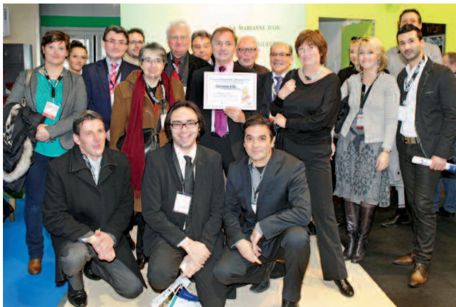
Élus et agents de la collectivité lors de la remise de la Marianne d'or du développement durable, le 20 novembre, à Paris, à l'occasion du Salon des maires.

Après le Trophée or du cadre de vie, remis en octobre dernier dans le cadre du Festival Fimbacte, et un Territoria d'or dans la catégorie « Aménagement et urbanisme », décerné par l'Observatoire national de l'innovation publique, la Ville de Houilles a été primée par une Marianne d'or du développement durable pour son projet : « Le développement durable au cœur du projet de ville ». Le prix a été remis au maire, le 20 novembre, durant