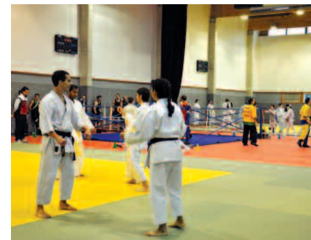
La salle de dojo du gymnase Jean-Guimier II.

tut national des sports et de l'éducation physique (INSEP), plus d'une dizaine de judokas au métier de professeur. Tous ses élèves se souviennent « d'un professeur charismatique dont le talent technique et pédagogique n'avait d'égal que sa grande gentillesse ». Une plaque en son souvenir a été posée dans la salle du gymnase lors d'un hommage officiel qui s'est déroulé, fin novembre, en présence du maire, d'élus locaux, de membres du Gant d'Or et de représentants associatifs et sportifs. ■