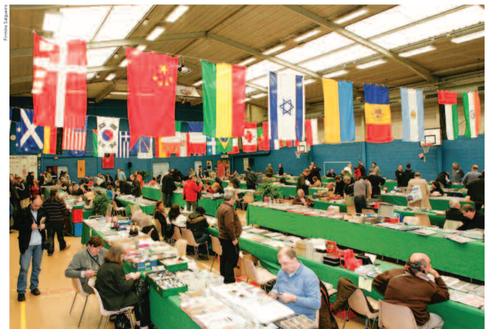
Le Salon international de la télécarte réunit des exposants en provenance de près de 80 pays.

Salon international de la télécarte. Samedi 25 janvier de 10 h à 18 h et dimanche 26 janvier de 8 h 30 à 16 h. Entrée : 2 € (ou 3 € pour les 2 jours). Gratuit le dimanche après-midi. Espace Ostermeyer (16, rue Louise-Michel).