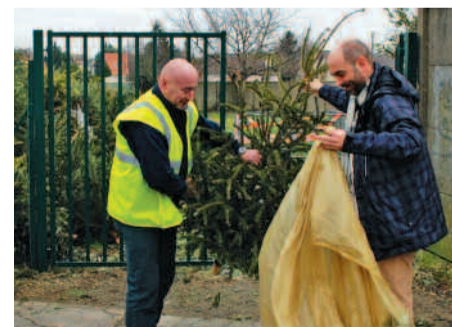
Point de collecte des sapins sur la plate-forme, rue Nicolas-Chrispeels.

Grâce à cette collecte, les arbres collectés pourront être transformés en compost