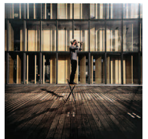
La photographie L'Océan des villes , Prix de la Ville 2013.

Retrouvez le travail de Sébastien Tabuteaud sur le site www.petitescargot-photos.com