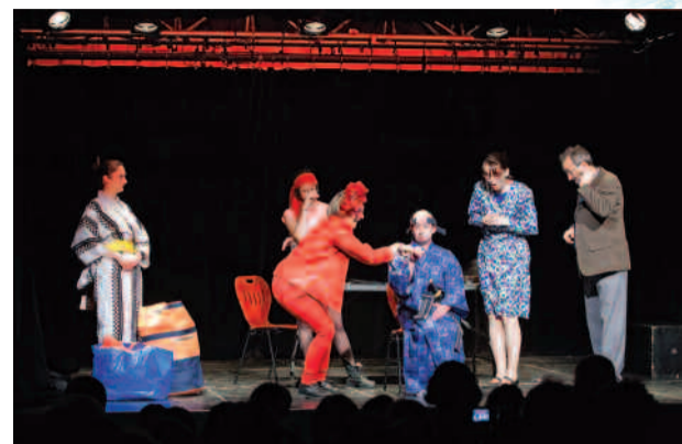
Spectacle de fin d'année, au Triplex, des élèves de l'atelier de pratique théâtrale.

Cours d'arts plastiques à La Graineterie.