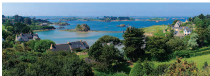
L'île de Bréhat fait partie d'un programme varié d'excursions.

Le centre communal d'action sociale (CCAS) propose chaque année, au printemps, un séjour de six jours dans une région de France aux personnes âgées de 60 ans et plus, ainsi qu'aux personnes à mobilité réduite. Ce séjour a pour vocation de faire découvrir le patrimoine historique, culturel et naturel des régions françaises dans une ambiance conviviale et à un rythme modéré. Lors des excursions, tout est prévu pour le confort de chacun, y compris pour les participants éprouvant des difficultés à se déplacer.