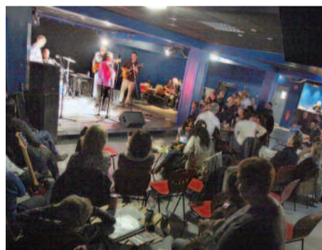
Soirée bœuf au Triplex.

Une scène musicale ouverte à tous ! Chaque deuxième mardi du mois, chanteurs et musiciens se réunissent au Triplex pour des échanges musicaux qui se déclinent sur tous les tons : rock, folk, pop, jazz, reggae... Le principe est simple, le but est de faire de la musique, quel que soit son niveau. Pour les participants, c'est une occasion unique pour se produire sur scène dans des conditions techniques dignes de vrais pros, devant un public toujours fidèle. Ambiance festive garantie ! Les musiciens et chanteurs qui souhaitent y participer doivent s'inscrire à l'avance de manière à planifier dans de bonnes conditions le déroulement de la soirée. ■