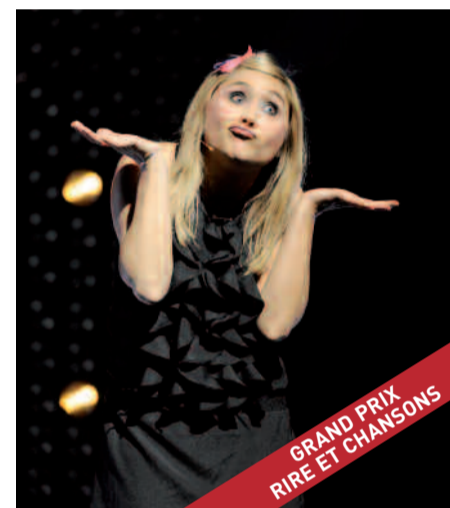
Bérengère Krief manie l'autodérision comme personne.

Révélee par le café-théâtre et la série télé « Bref », diffusée sur Canal +, Bérengère Krief participe régulièrement aux plus grands festivals d'humour (Montreux