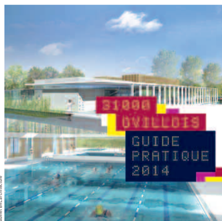
Cabinet PIA architectes

Les habitants y trouveront des renseignements très pratiques pour accomplir diverses formalités (attestation d'accueil, carte nationale d'identité, carte grise, certificat de concubinage...) ainsi que des informations concrètes portant sur différents domaines (vie municipale, environnement, transports, enfance, social, santé,