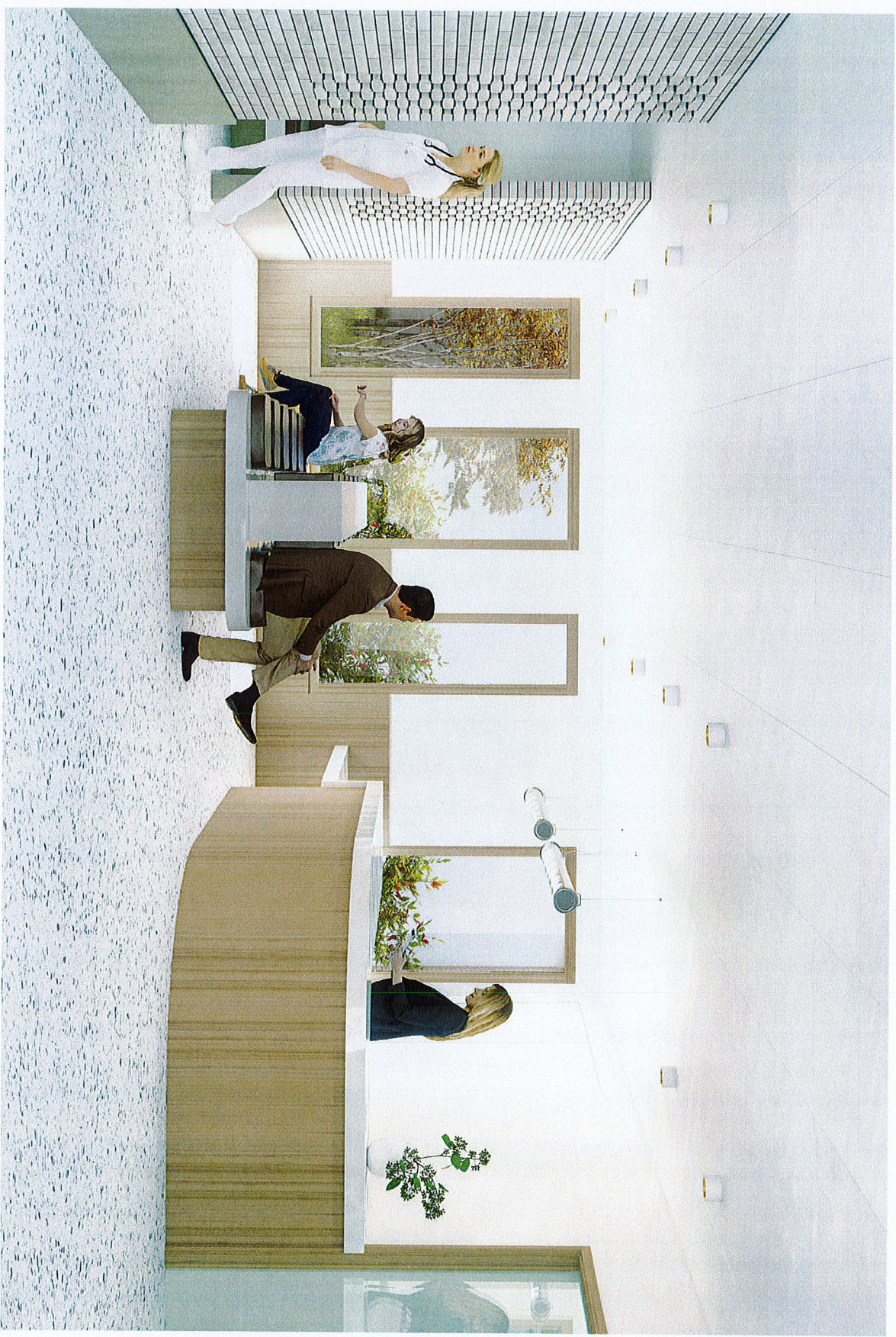
VUE DEPUIS LE HALL D'ACCUEIL DE LA MAISON DE SANTE