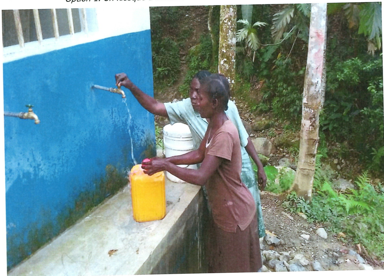
Option 1. Un kiosque à eau nouvellement installé à Fond Margot en Haïti.

2 500 habitants de Fond Margot s'approvisionnaient en eau soit à la rivière située en contrebas, soit à une source située dans les hauteurs. Sur 2 ans, le SEDIF a cofinancé, pour 200 k€, la construction d'un captage, un réservoir, 4 kilomètres de conduites et 11 kiosques à eau, ainsi que la formation d'un comité villageois à l'exploitation du réseau de canalisations et à la distribution d'eau potable.